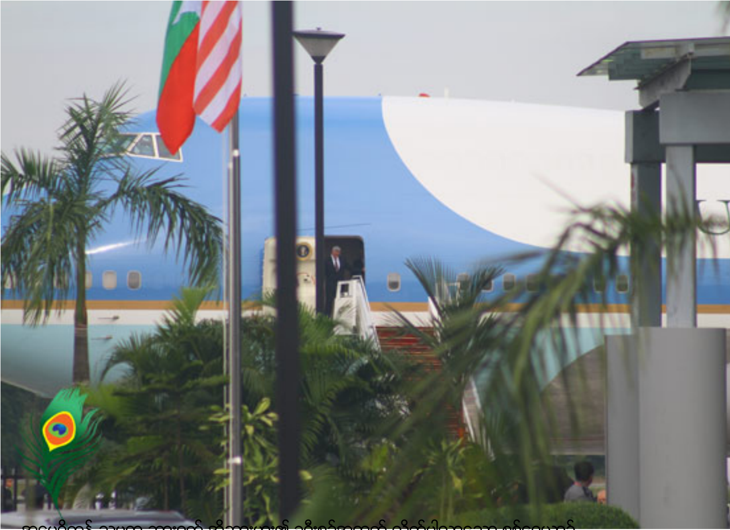
အမေရိကန် သမ္မတ ဘားရက် အိုဘားမား၏ ခရီးစဉ်အတွက် လိုက်ပါလာသော စစ်ရေးဗဟို

တနင်္ဂနွေနေ့၊ နိုဝင်ဘာလ ၁၈ ရက် ၂၀၁၂ ခုနှစ် ၁၉ နာရီ ၂၂ မိနစ်